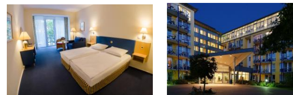
3*** IFA Rügen Hotel & Ferienpark